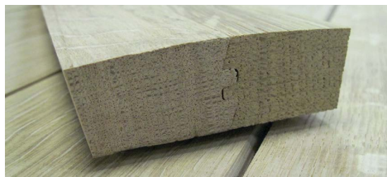
Patentierter Nut- und Federverbindung

Die Besonderheit des ECO 3 liegt in ihrer Zusammensetzung. Es handelt sich um eine Nut- und Federverbindung schmaler Dauben® (Standarddicke und Beachtung der Holzmaserung, aber geringere Breite). Für eine Standarddaube benötigt man zwei dieser schmalen Dauben.